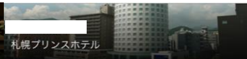
札幌プリンスホテル